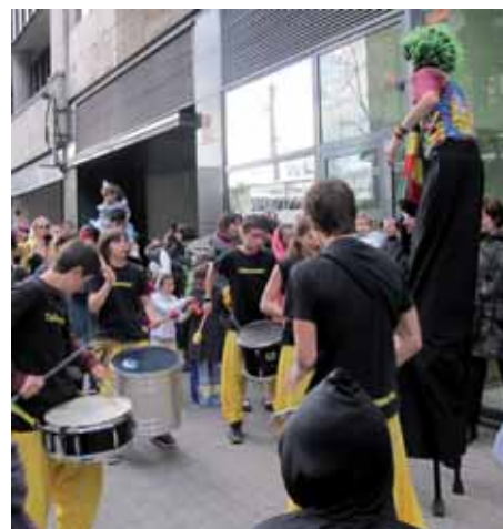
Festa de Carnestoltes 2011