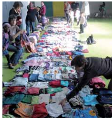
Fira de roba de segona mà

APUNTA'T A ALGUNA COMISIÓ TU TAMBÉ ETS ESCOLAIII